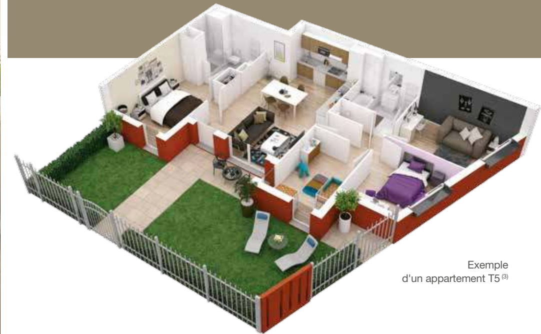
Exemple d'un appartement T5 (9)